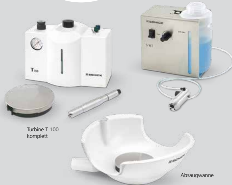
Turbine T 100 komplett