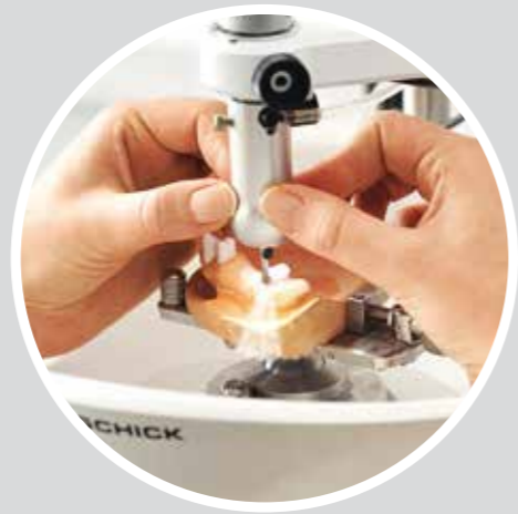
S W1 Wasserkühlung für Frässpindel